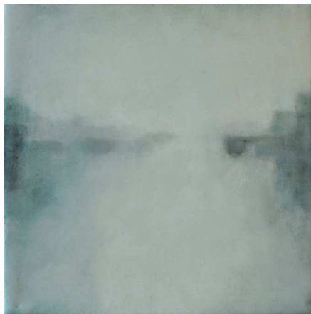
Summer Grey, 2012, Encaustic and oil on panel, 20 x 20 x 4 cm

elle a une matité, mais vu de côté, elle devient brillante, miroitante avec une surface légèrement ondulée. Il s'agit de la surface de l'eau qui dort, une réflexion vitreuse, captant la lumière ambiante et la rassemblant en des zones lumineuses.