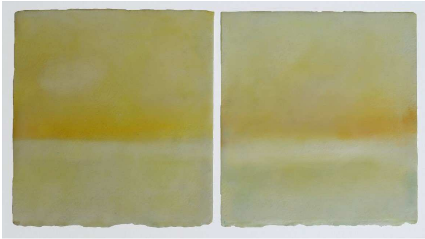
Yellow on Gold, 2012, Encaustic on paper, 19 x 16cm