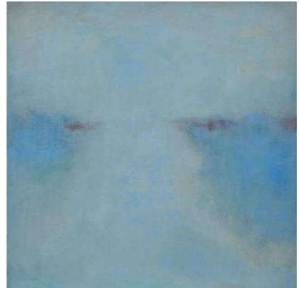
Blue on Blue, 2012, Wax encaustic & oil on panel. 40 x 40 x 6 cm

Encaustique signifie littéralement: ce qui est brûlé à l'intérieur, et toute véritable peinture à l'encaustique comprend de la cire chauffée et un processus de fusion des couches. Les