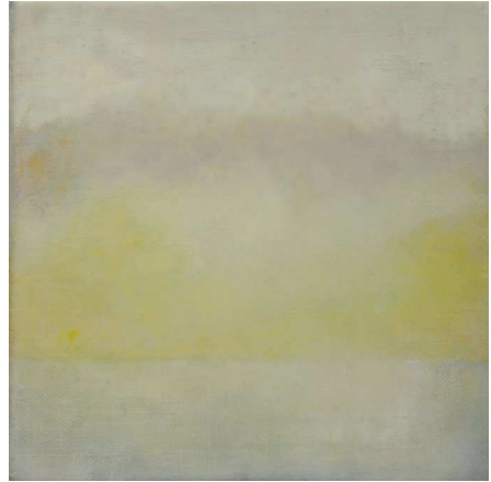
Holland Light, 2011 Encaustic, and oil on panel, 20 x 20 x 4 cm

In scale, some of Yntema's paintings are large enough to physically enter, full of air and light, and in other paintings, only the scale is small. They are like peepholes into an unimaginably vast space beyond. The boundaries between scale and size are diminished. In this way, the scope of the space is not held in by the size of the painting.