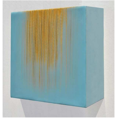
Light Ray, 2013, Wax encaustic on panel, 15 x 15 x 6cm