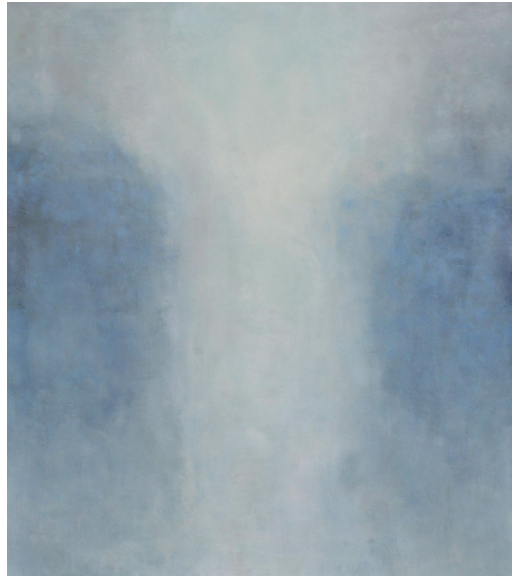
Crystal Days, 2012, Encaustic and oil on panel, 70 x 60 x 4 cm