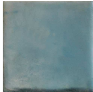
Untitled, 2009-2012. Wax encaustic and oil on canvas mounted on panel, 10 x 10 x 4 cm