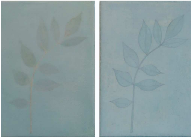
Ash Botanical, 2009, Wax encaustic, leaves, and oil on panel, 18 x 26 x 4 cm