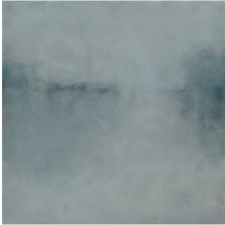
Shades of Grey, 2012, Encaustic and oil on panel, 60 x 60 x 4 cm

Yntema further develops the radiant feeling light emanating from the materials by carefully choosing her colours and surface texture. Yntema's colour, in creating silence and simplicity, is the melting sky, the sunrise and the sunset through water, given in blues, greens, yellows, pinks, violets, and browns. Overlaid together, they continually swirl and drift. She depicts sky, undifferentiated particles of atmosphere, opening spaces that seem to breathe.