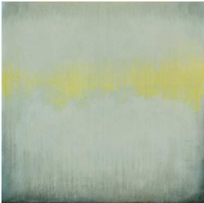
Divided Grey, 2011, Wax encaustic and oil on panel, 20 x 20 x 4 cm