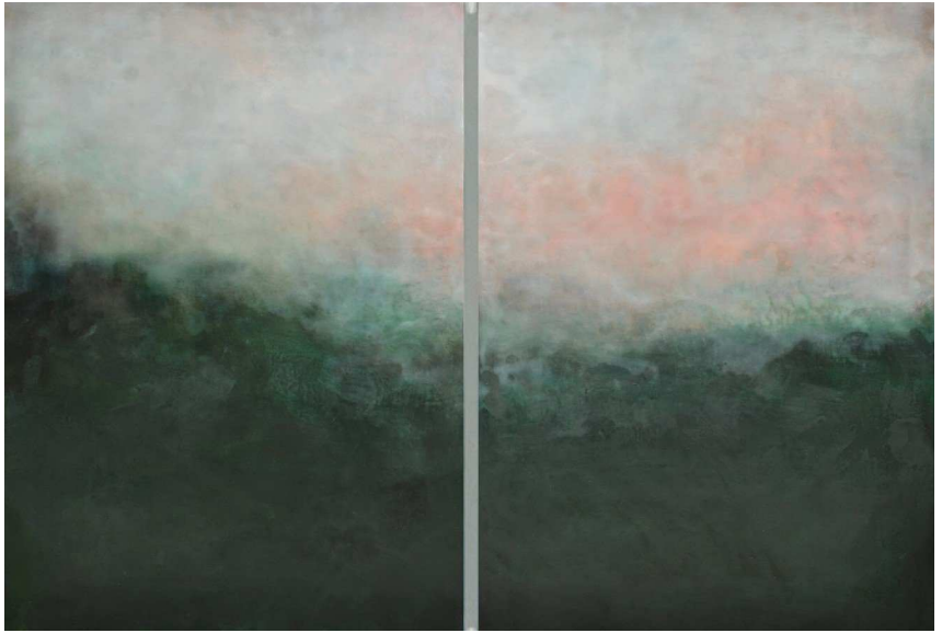
Rose Landscape, 2012, Encaustic and oil on panel, 84 x 122 x 4 cm