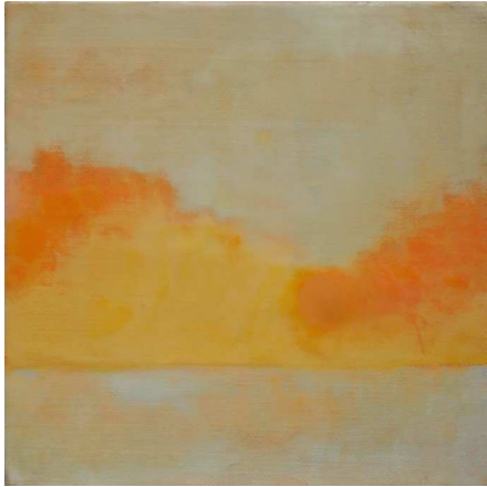
Mandarine Light, 2012, Wax encaustic & oil on panel, 20 x 20 x 4 cm

dilue, mélange, et fait adhérer les couches de couleur l'une à l'autre, les transformant en couches translucides au ton lumineux. Elle polit ensuite les surfaces avec un coton extrêmement doux afin d'obtenir une brillance subtile.