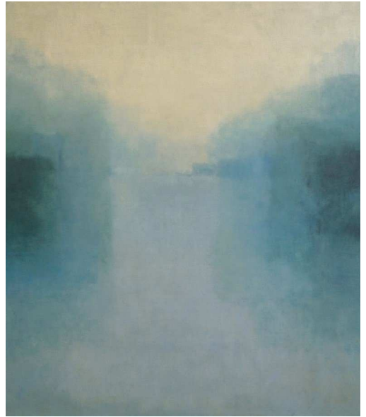
Absence and Presence, 2009 Encaustic and oil on panel, 120 x 105 x 4 cm