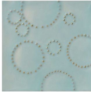
Concentrics I, II, III, 2011, Encaustic and brass on panel, 17 x 17 x 3.5 cm each