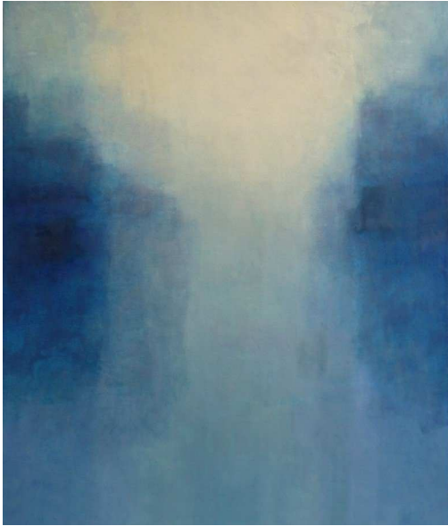
Daybreak, 2009 Encaustic and oil on panel, 120 x 105 x 4 cm