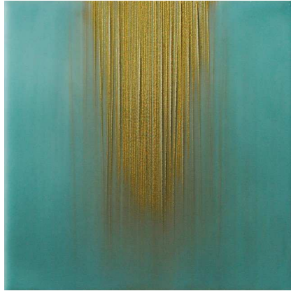
Water, 2013, Wax Encaustic mixed medie on panel, 15 x 15 x 4 cm