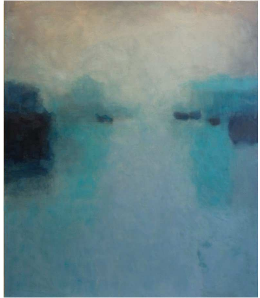
Evening Still, 2009 Encaustic and oil on panel, 120 x 105 x 4 cm