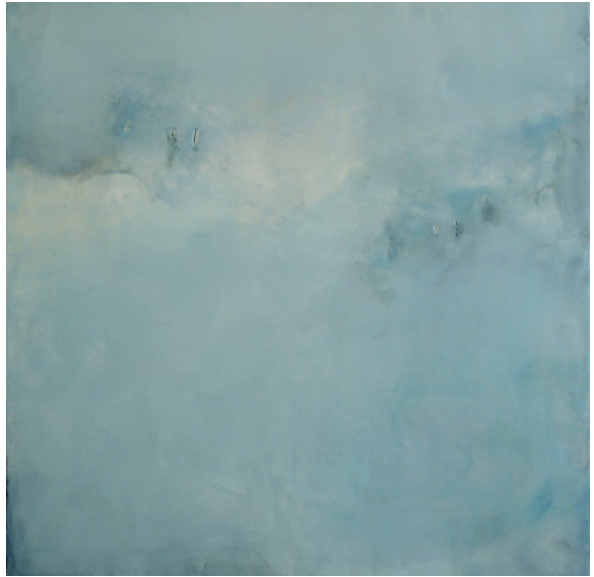
Solid Air, 2009, Wax encaustic & oil on panel, 60 x 60 x 4 cm